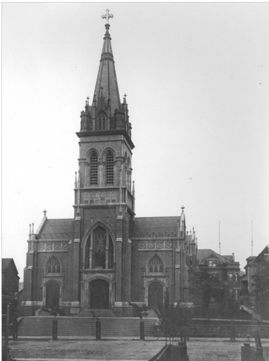
Nový Kostol vo Wilkes-Barre, ktorý vybudoval J. Murgaš.

Pod Nízkymi Tatrami tam v starom baníckom mestečku, kde tiež Jozef Gregor Tajovský narodil sa aj Murgaš 17. februára 1864. Chudobní roľníci boli jeho rodičia, ktorí synkovi snažili sa dať vzdelanie. Školu elementárnu vychodil v rodisku a šiestu triedu navštevoval ako klerik Emerikanista v Bratislave, siedmu, ôsmu jako i dva roky bohoslovnia štúdoval v Ostrihome. Už ako gymnazista so záľubou sledoval výsledky techniky, zvlášť ale vtedy svet