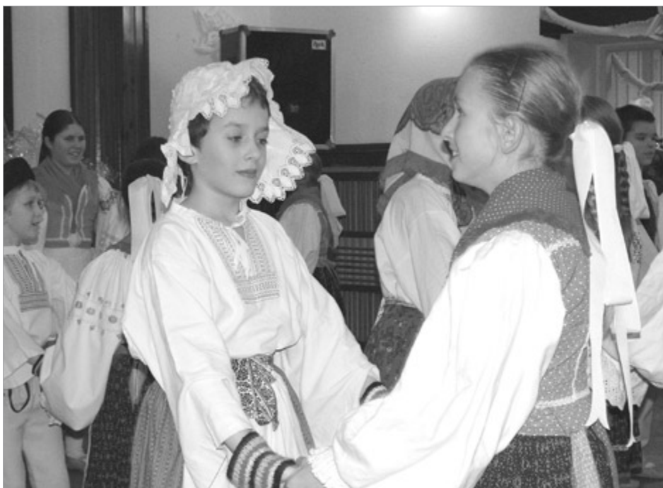
Na plese vystúpil detský folklórny súbor Matičiarik.