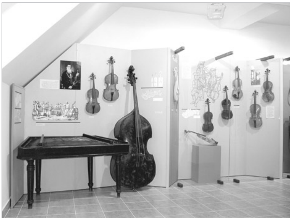
Expozícia Ľudové hudobné nástroje na Slovensku

Literárne a hudobné múzeum v Banskej Bystrici (LHM) bolo zriadené 1. marca 1969 rozhodnutím rady Okresného národného výboru v Banskej Bystrici ako múzeum s pôsobnosťou v okresoch Banská Bystrica, Lučenec, Rimavská Sobota a na Pohroní. Jeho poslaním bolo zhromažďovať, spravovať, sprístupňovať a vedecky skúmať pamiatky, ktoré majú vzťah k literárnemu a hudobnému životu vymedzeného územia. Vývoj však čoskoro priniesol zúženie pôsobnosti len na okres Banská Bystrica, čo pretrvalo až do delimitácie múzea pod správu Ministerstva kultúry SR od 1. januára 1991, kedy sa rozšírila na územie stredného Slovenska. Hlavné poslanie však zostalo zachované.