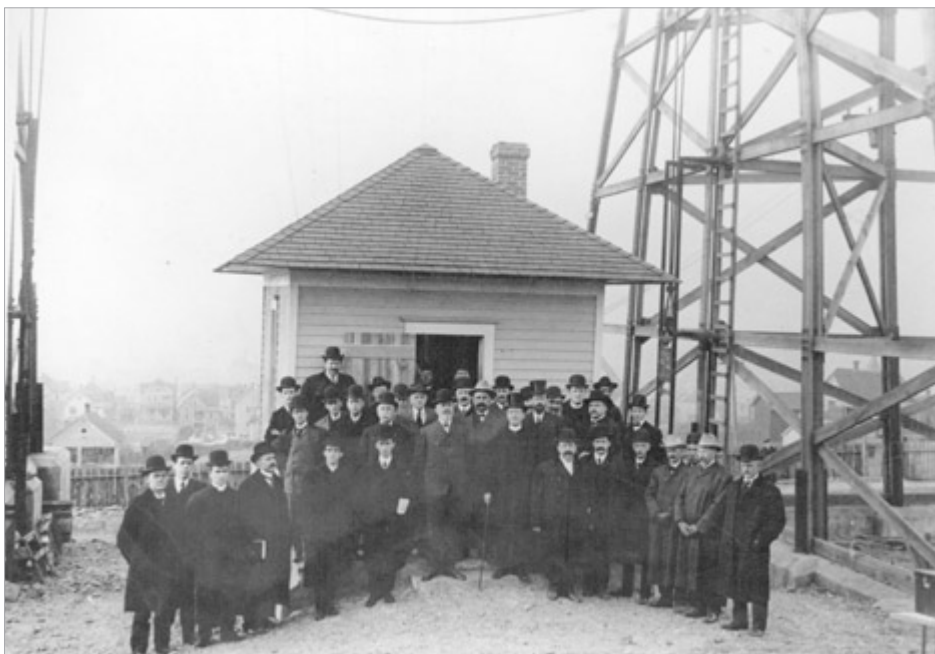
Prvá verejná skúška v prítomnosti hostí r. 1905

Druhá čiastka vynálezu Murgašovho je zvláštny detektor, čili prístroj k zisteniu prítomnosti elektrických vln, takzvaný Murgašov imperfekt kontakt (nedokonalý dotyk). Tento prístroj pozostáva z otáčajúcej ihly, na túto ihlu sa dotýkajú malým tlakom drobné kúsky uhľa, alebo grafitu. Ihla jednu otočku vykoná za hodinu a je pohybovaná hodinovým strojom.