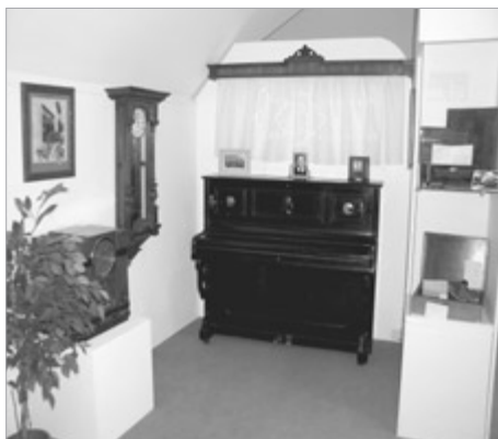
Salón spisovateľky Terézie Vansovej v expozícii Múzeum-domov múz

Od roku 2001 sa múzeum stalo súčasťou banskobystrickej Štátnej vedeckej knižnice ako jej špecializovaný organizačný útvar. Vo svojej činnosti sa zameriava na dokumentáciu literárnych a hudobných osobností viažucich sa k regiónu Banská Bystrica a stredné Slovensko, ale dokumentuje aj divadelné a hudobné súbory, spolky, tlačiarov, významné podujatia a udalosti a zabezpečuje tiež špecializovanú celoslovenskú dokumentáciu výroby a uplatňovania ľudových hudobných nástrojov na Slovensku. V zbierkovom fonde (takmer 50 tisíc zbierkových predmetov) sú staré vzácne tlače i nová knižná produkcia spisovateľov, plagáty, bulletiny, archívne dokumenty, literárne a hudobné rukopisy umeleckých a vedeckých diel, audiovizuálne nahrávky diel, podujatí a rozhovorov s osobnosťami, fotografie, výtvarné diela, zbierky z oblasti divadelníctva, ľudové a klasické hudobné nástroje, trojrozmerné vecné i osobné pamiatky. Bohatý zbierkový fond a ústavná knižnica je k dis-