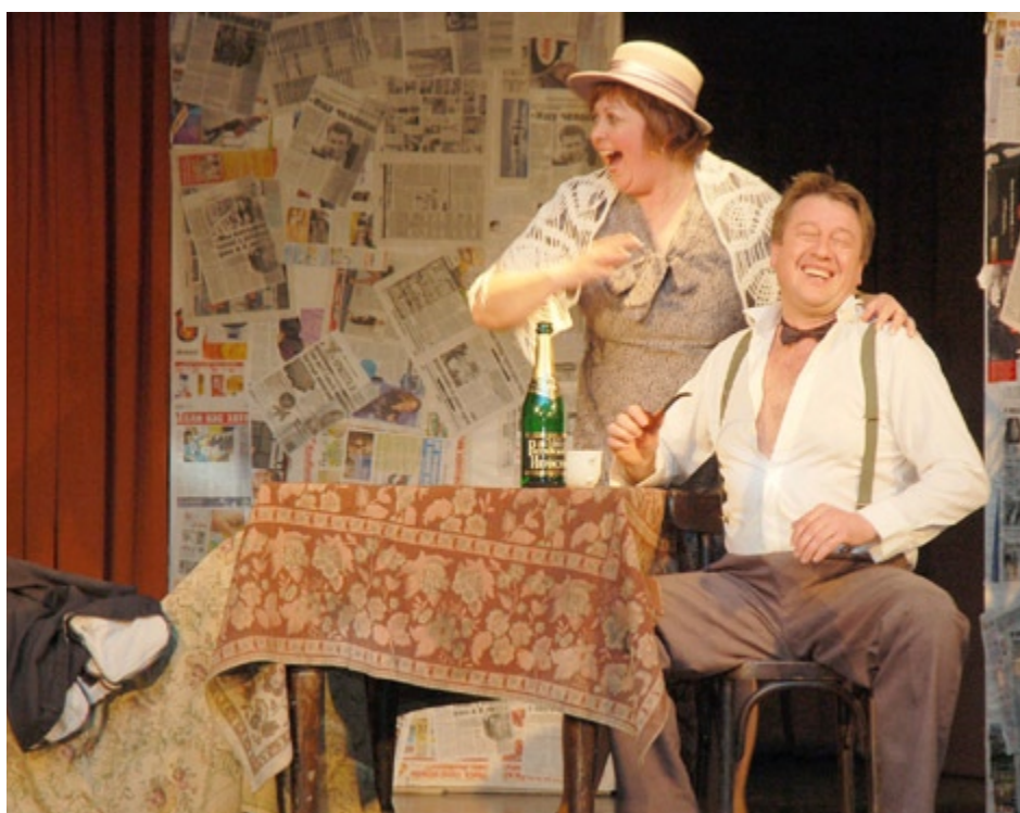
Scéna Nahováračky z hry N. V. Gogoľa Ženba v podaní hercov DOS z Medzibrodu